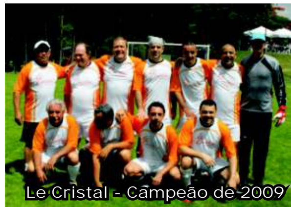
Le Cristal - Campeão de 2009

Veja detalhes e números do campeonato em www.sar6.com.br