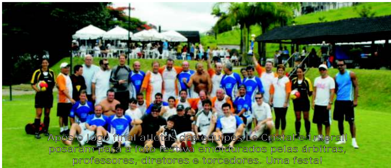
Após o jogo final atletas das equipes Le Cristal e Interall posaram para a foto festiva emoldurados pelas árbitras, professores, diretores e torcedores. Uma festa!