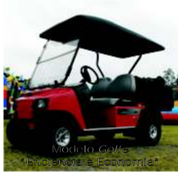
Modelo Golfe "Eficiência e Economia"

De acordo com a Diretoria, operacionalmente o equipamento foi um sucesso, tanto na questão econômica (combustível e manutenção), quanto na vigilância.